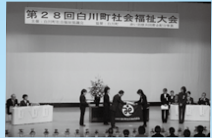
ふくし講演会開催事業