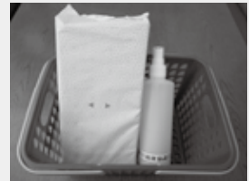
▶ 社協が配布した消毒セット