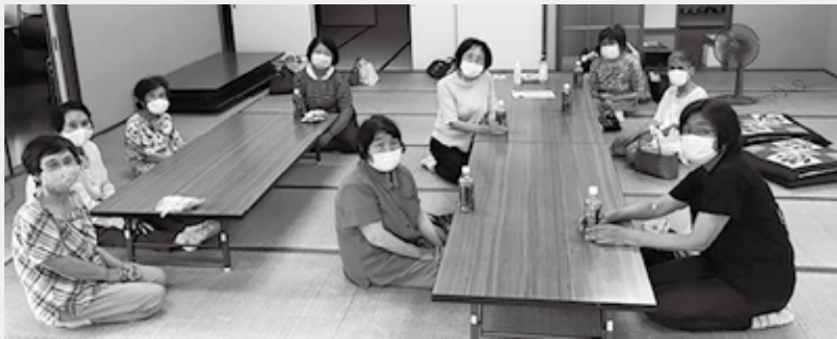
▲ 新しい生活様式でのサロン開催

今回は、各サロンの希望に応じて、代表者や班長の方にサロン会員を訪問してもらい、社協が作成したコロナ予防策や繋がりに関するプリントと一緒に、脳トレ（計算）ドリルやスクラッチアート、工作（万華鏡）キットを配布してもらいました。コロナ禍では人との繋がりが薄れがちですが、サロン活動がきっかけとなり、地域での繋がりを維持できると良いです。