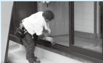
ひとり暮らし世帯清掃事業

ひとり暮らし高齢者世帯や母子・父子家庭、低所得者の方々が、安心して新年を迎えていただくための事業に役立てられます。