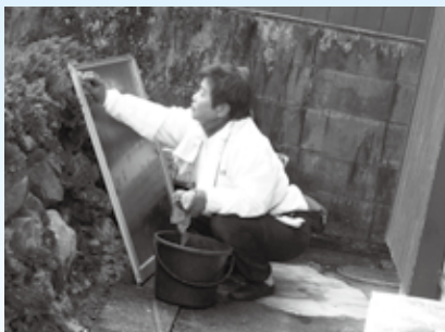
ひとり暮らし世帯清掃事業

ひとり暮らし高齢者世帯、母子・父子家庭や低所得者の方々が、安心して新年を迎えていただくための事業に役立てられます。