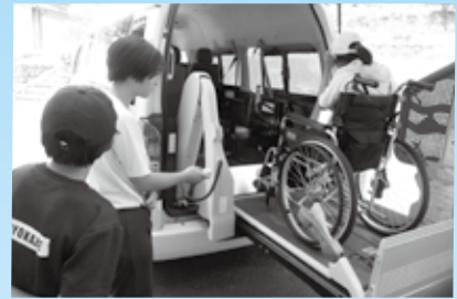
ボランティアスクール学習事業