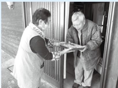
歳末食事サービス事業

ひとり暮らし高齢者世帯、母子・父子家庭や低所得者の方々が、安心して新年を迎えていただくための事業に役立てられます。