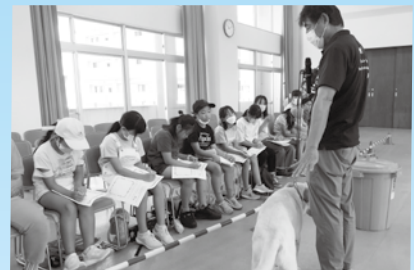
ボランティアスクール学習事業