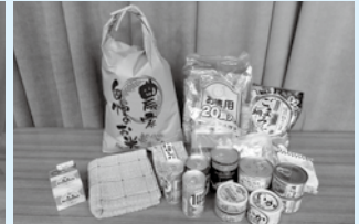
実際にお届けしている1世帯分の食品です